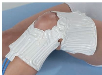
Accesorio de Rodilla