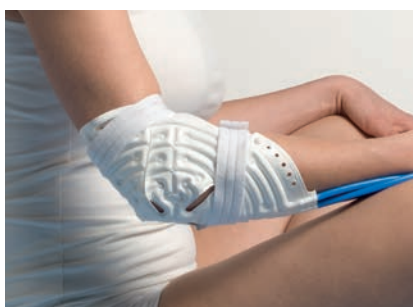
Accesorio de codo