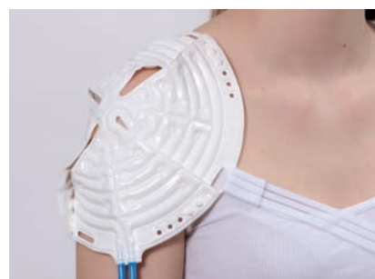
Accesorio de Hombro