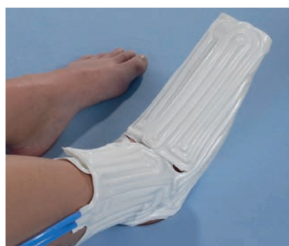
Accesorio de pie

Existen accesorios anatómicos diseñados para cualquier parte del cuerpo.