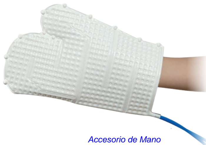
Accesorio de Mano